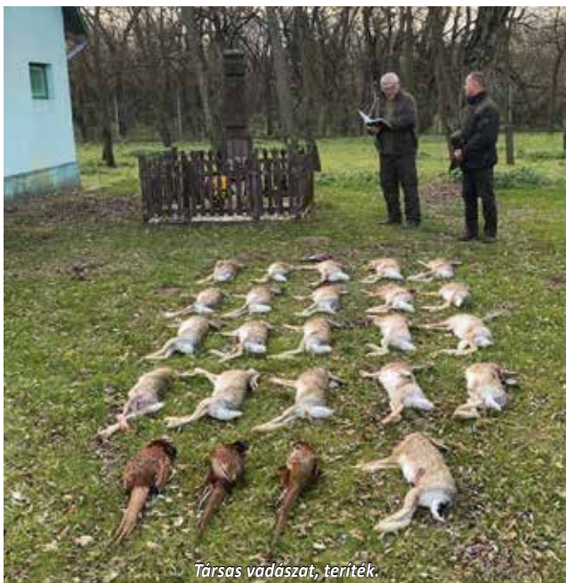
Társas vadászat, teríték.