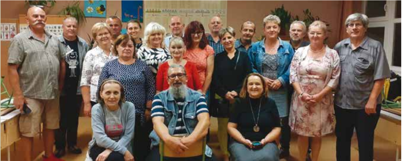
A 40 éves találkozó résztvevői.