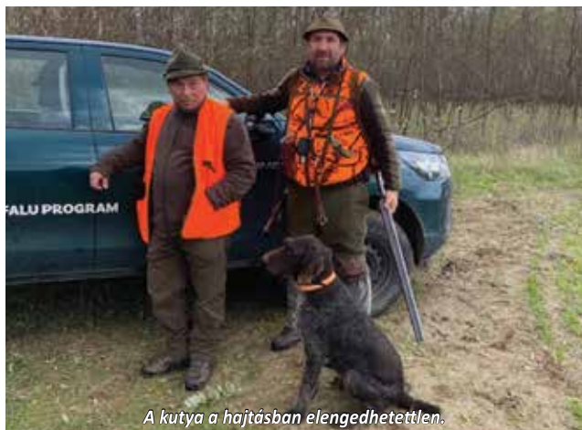
A kutya a hajtásban elengedhetetlen.