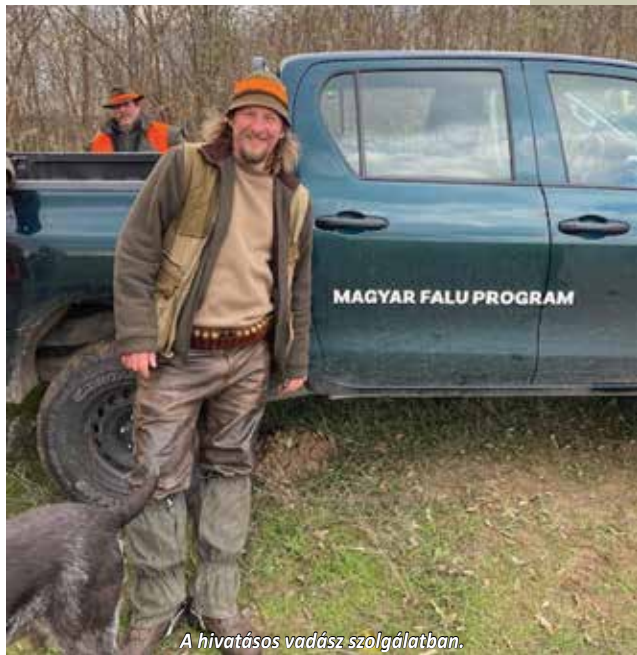
A hivatásos vadász szolgálatban.