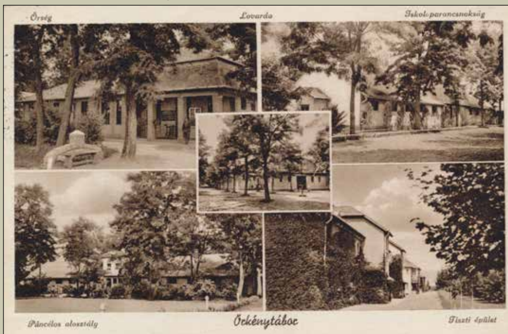
Örkénytábor 1939. Sponga Tamás gyűjtése. (Forrás: https://www.taborfalva-konyvtar.hu/ )