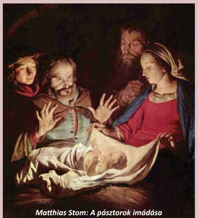
Matthias Stom: A pásztorok imádása