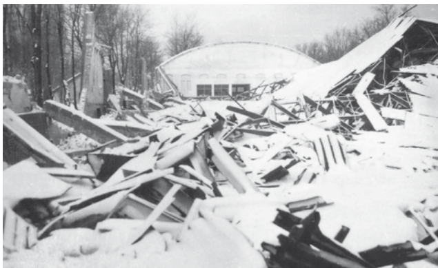
Az 1943 telén, a hó súlya alatt összedőlt nagy lovarda maradványai