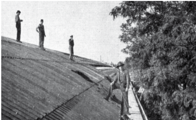
A műpala hullámlemezek felrakása (Tér és Forma, 1931. április)

„A műpala-hullámlemezek rozsdabarna színűek, és mély fény- és árnyékhatásukkal az épület képét előnyösen befolyásolják”.