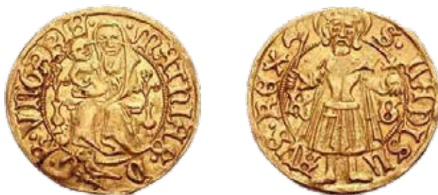
Mátyás király Máriával díszített aranypénze

Mátyás királytól kezdve egészen 1849-ig majdnem kivétel nélkül a Patrona Hungariae képével ékesek a magyar fémpénzek. Ezeket hívták „máriásoknak”.