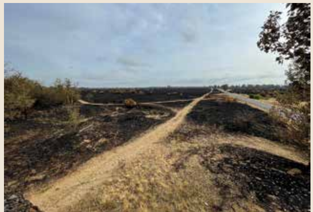
A leégett lőtér 2022 augusztusában.