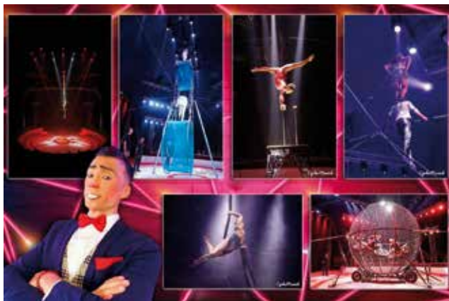
A 2022. évi turné utolsó állomása, Dabas. Pillanatképek az előadásról. (A montázst készítette Mr. Gerald)