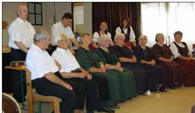
A Táborfalvi Népzenei Együttes fellépése Burgenlandban, Alsóőr (2006)

Az éneklés megmaradt egy életen át, a népzenei együttesben is, de a magánéletben is, lakodalomban, disznótoros vacsorákon is. Szerettük a munkát, szerettük a barátságot.