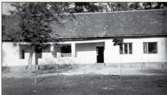
Szobros Iskola (1960)