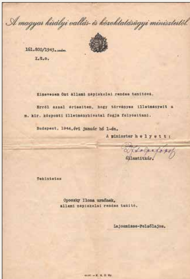
Kinevezés népi iskolai tanítónak