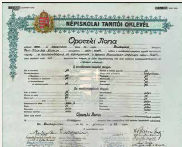
Néptanítói oklevél Opczki Ilona számára