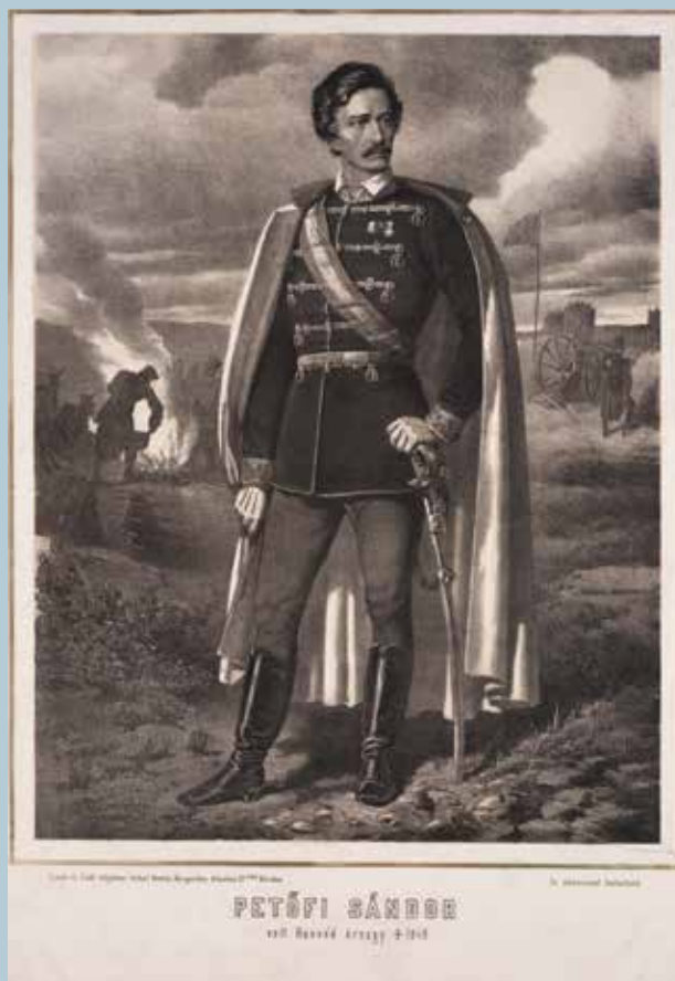
Fotó: Petőfi Sándor honvéd őrnagy (1849)

(Petőfi Sándor: A XIX. század költői (1847) - részlet)