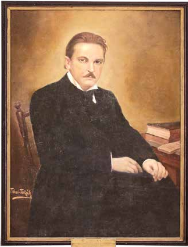
Tibai Takács János: Gyóni Géza

A szenzáció erejével hatott a 2020. október 21-i sajtóhíradás, miszerint egykori magyar hadifoglyok rejtőző kézirataira találtak rá a Krasznójarszki Helytörténeti Múzeum raktárában. A 20 füzetnyi, immár évszázados lelet legértékesebb kéziratfüzete Gyóni Géza életrajzát és verseit tartalmazza 211 oldalon, melyet Székely Lajos (1883-1919) tartalékos főhadnagy, marosvásárhelyi tanár szerkesztett. Székely tanár úr búcsúztatta a költőt a krasznójarszki hadifogoly temető sírhantjánál, majd a temetés után az egész tábort bejárta Gyóni Géza verskézíratainak összegyűjtéséért.