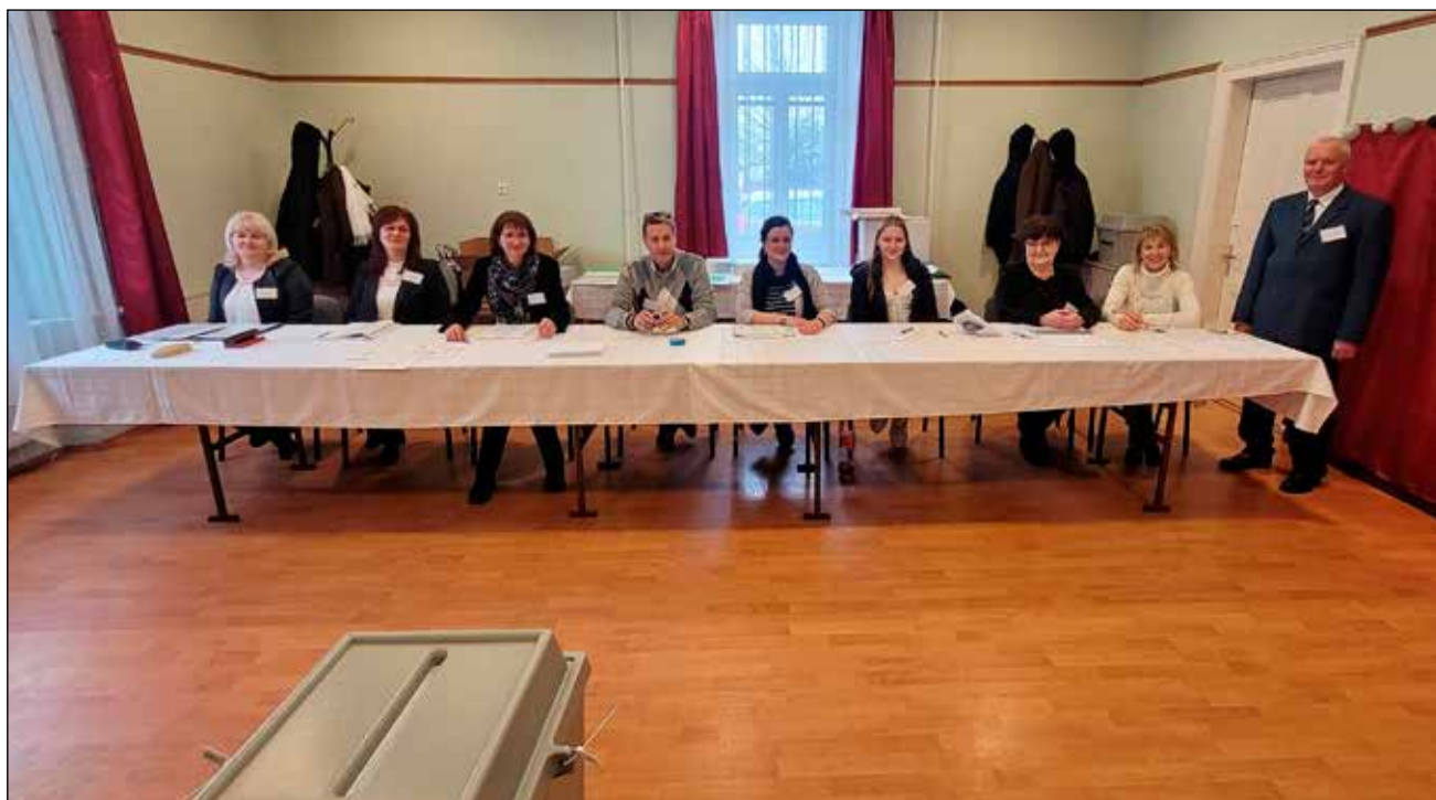
1-es számú szavazókör szavazatszámoló bizottság