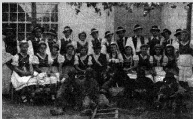
Táborfalvi felvonulók 1946-ban.