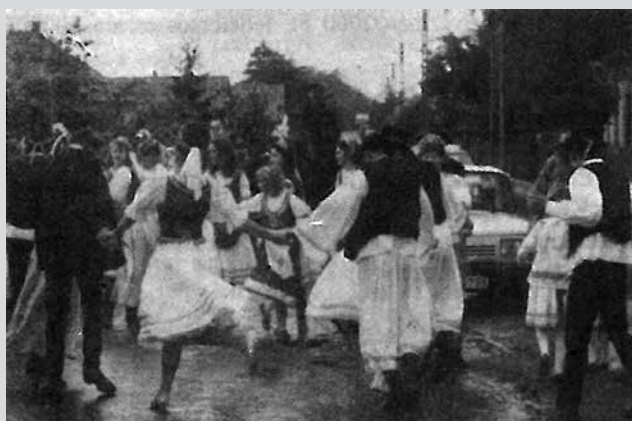
Szüreti menet 1993-ban.