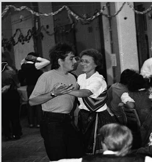
Bálozók 1991-ben.