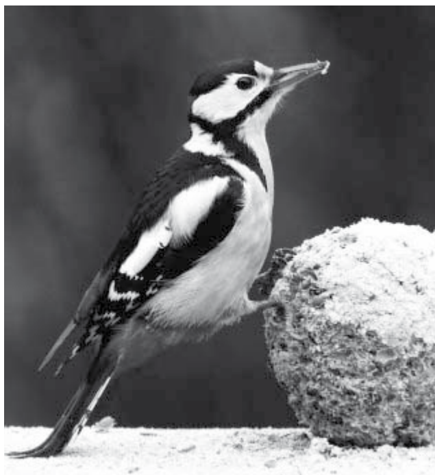
Nagy fakopáncs az etetőn (Fotó: Orbán Zoltán).

Az etetőben napokig, hetekig is elfogyasztatlanul maradó kenyérfélék erjedésnek indulva gyomor- és bélgyulladást, akár a madarak pusztulását okozhatja.