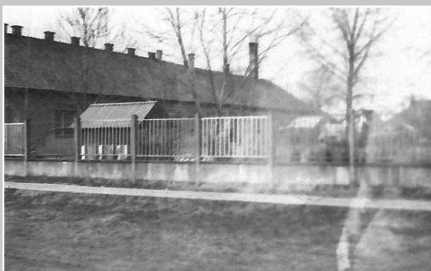
Az óvoda az 1970-es években.