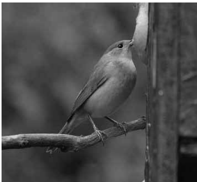
Vonuló barátposzáta itató mellé kihelyezett almából csipeget.

Természetesen kerülhetünk olyan élethelyzetbe, hogy nem tudunk folyamatosan etetni. Ilyenkor, ha van néhány napunk az átállásra, naponta csökkentjük a kihelyezett eleség mennyiségét. A madarak, érzékelve a táplálék megfoggyatkozását, egyre nagyobb körben keresgélnek, majd továbbáznak a környékről. További segítség a madaraknak, ha az etetést lehetőleg nem a tél leghidegebb napjaiban hagyjuk abba.