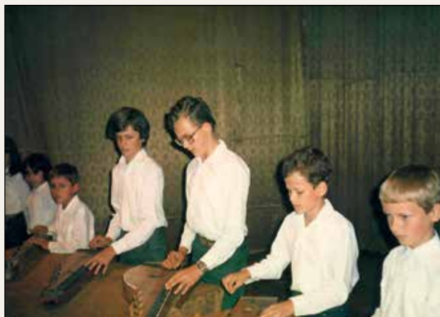
Szarkási citeraegyüttes (1980-as évek eleje)

Minden évben kirándultunk, megnéztük hazánk szép tájait, szülők, gyerekek együtt.