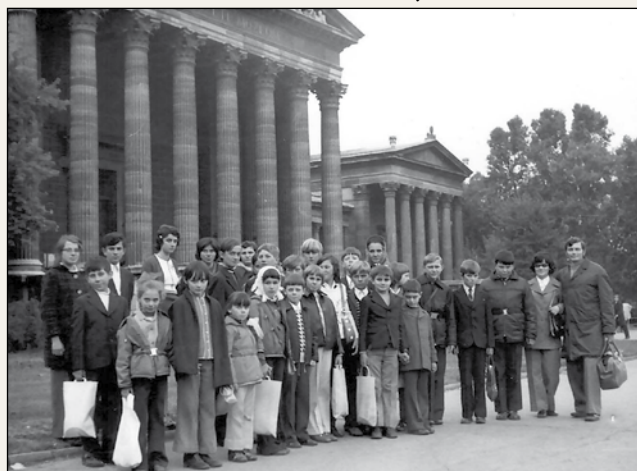
Szarkási Iskola; kirándulás, Szépművészeti Múzeum, Budapest (1970-es évek vége)