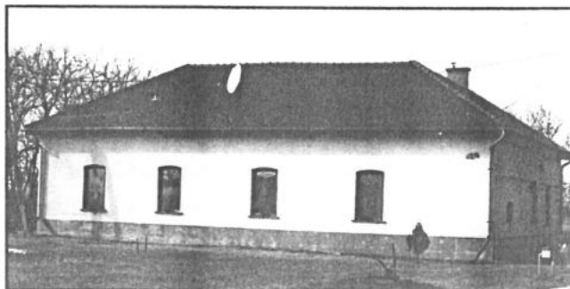
A Csurgay-major napjainkban