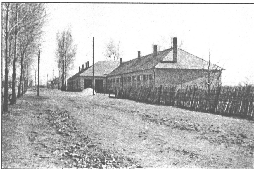
Általános iskola az 1967-es felújítás után