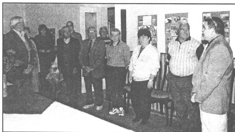
A kiállítás megnyitóján

A Magyar Honvédelem Napja és Táborfalva önállóvá válásának 50. évfordulója tiszteletére a Helyőrségi Nyugdíjas Klub fotókiállítást szervezett a HEK dolgozóinak segítségével. A kiállítás megnyitóját 1999. május 19-én 14.00-kor tartották meg a Helyőrségi Tiszti Klubban. A megnyitón részt vettek a rendező nyugdíjas klub tagjain kívül az általános iskola, a falusi nyugdíjas klub és a helyőrségben szolgálatot teljesítő alakulatok képviselői is.