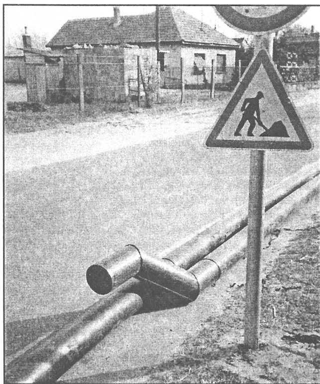
Vákuum szállítóvezeték kialakítása KPE csővezetékéből

A község belső hálózata teljesen elkészült, a nyo-