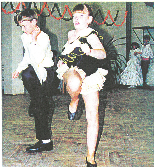
.. és rock 'n roll az alapítványi bálon