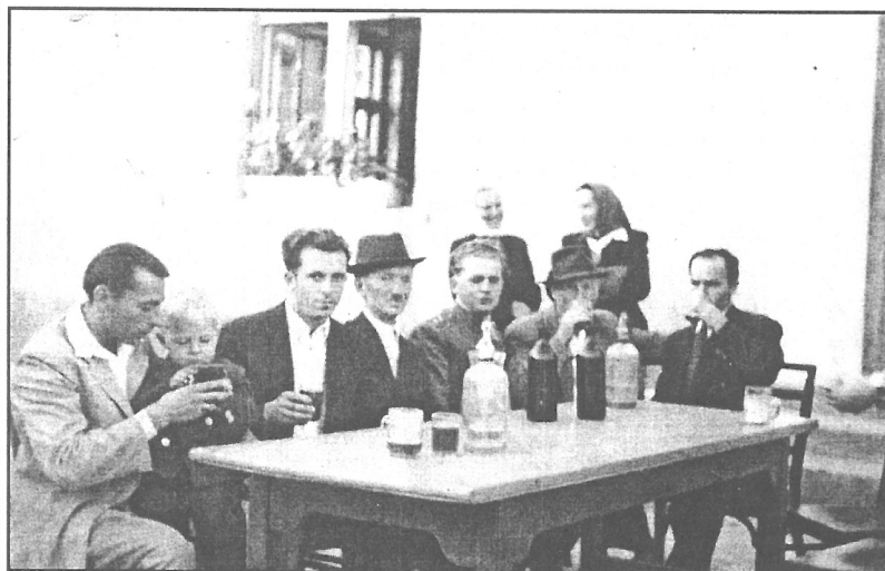
Egy régi kép...