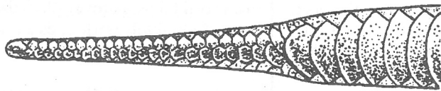
A vipera farki vége

Keresztes vipera: előfordulása Győr-Sopron, Bor-sod-Abauj-Zemp-lén,