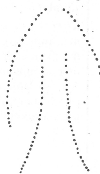
A vipera marási képe

félkör alakú, apró pontokból áll, amely eléggé vértzik, a viperamarás esetében két, egymástól 6-10 mm-nyi távolságra tűszúrásnyi pontok találhatók, amelyek kevésbé véreznek.