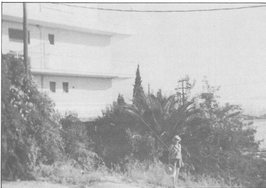
"Isteni volt az istenek hazájában"

Hétfőn kisebb vásárlást tettünk, és nekifogtunk a hazakészülődésnek, csomagolásnak. Még egy jót fürödtünk a tengerben. Este 9-kor volt az elmaradhatatlan görög búcsúest. Az est folyamán tombola is volt. Nyertünk egy szép kis kerámia vázát gyertyatartóval. Táncos műsorral szórakoztattak bennünket. Utána igyekeztek megtanítani mindenkit - több kevesebb sikerrel - a körtáncra. Igen jó volt a hangulat. A menü a következő volt: előétel - kis fasírtgolyók, leveles tészta virslivel töltve, sült patison, töltött padlizsán, szőlőlevél töltike valamint uborka saláta és kaviár; főétel - sült virsli mustárosan, kecske- és birkahús, gyros pita, rablólhús, héjában főtt burgonya, sárgarépás - zöldborsós rizs, sült paprika egész-