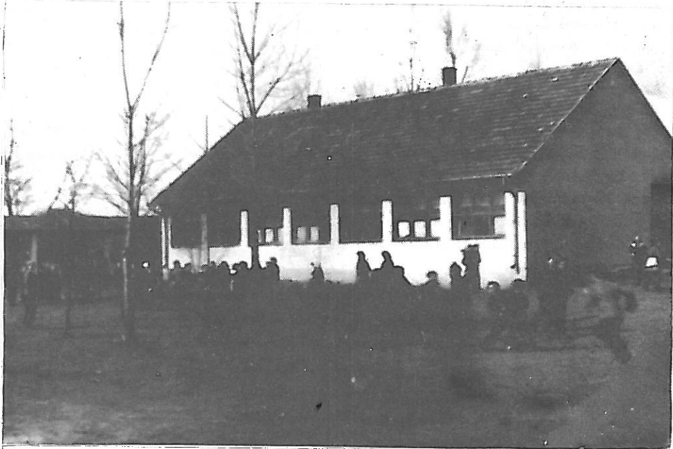
Az 1952-ben épült központi általános iskola

1952. június 1-én kapta meg a falu vezetése a Minisztertanács rendeletét a pedagógusnap megrendezéséről. Másnap, június 2-án a VB döntést is hozott az ügyben: "Június 8-án a község dolgozói hálával gondoljanak és ünnepeljék a nevelőket, kik fáradságot nem kímélve foglalkoznak a tanulókkal, és nevelik az új, szocialista embertípust a szocialista társadalom számára." Az ünnepség a következőképpen zajlott le: 10 órakor az új iskolában a tömegszervezetek műsorral köszöntötték a pedagógusokat, majd ebédet adtak a tiszteletükre. Délután a sportpályán futballmérkőzésre és más sporteseményekre került