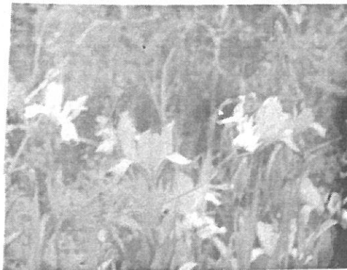
(1.) Tarka nőszirm

Több fajtát különböztetjük meg, ebből elég sok VÉDETT : pl: Tarka nőszirm (1. kép) (1000 Ft), Homoki nőszirm (2000 Ft), Apró nőszirm (2. kép) (1000 Ft). Ezek még megtalálhatók Táborfalván és környékén is!