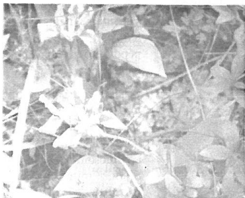
(2.) Apró nőszirm

A száraz, zárt és nyílt tölgyesekben, homo-kiréteken virítanak. Kedvelik a napsütést.