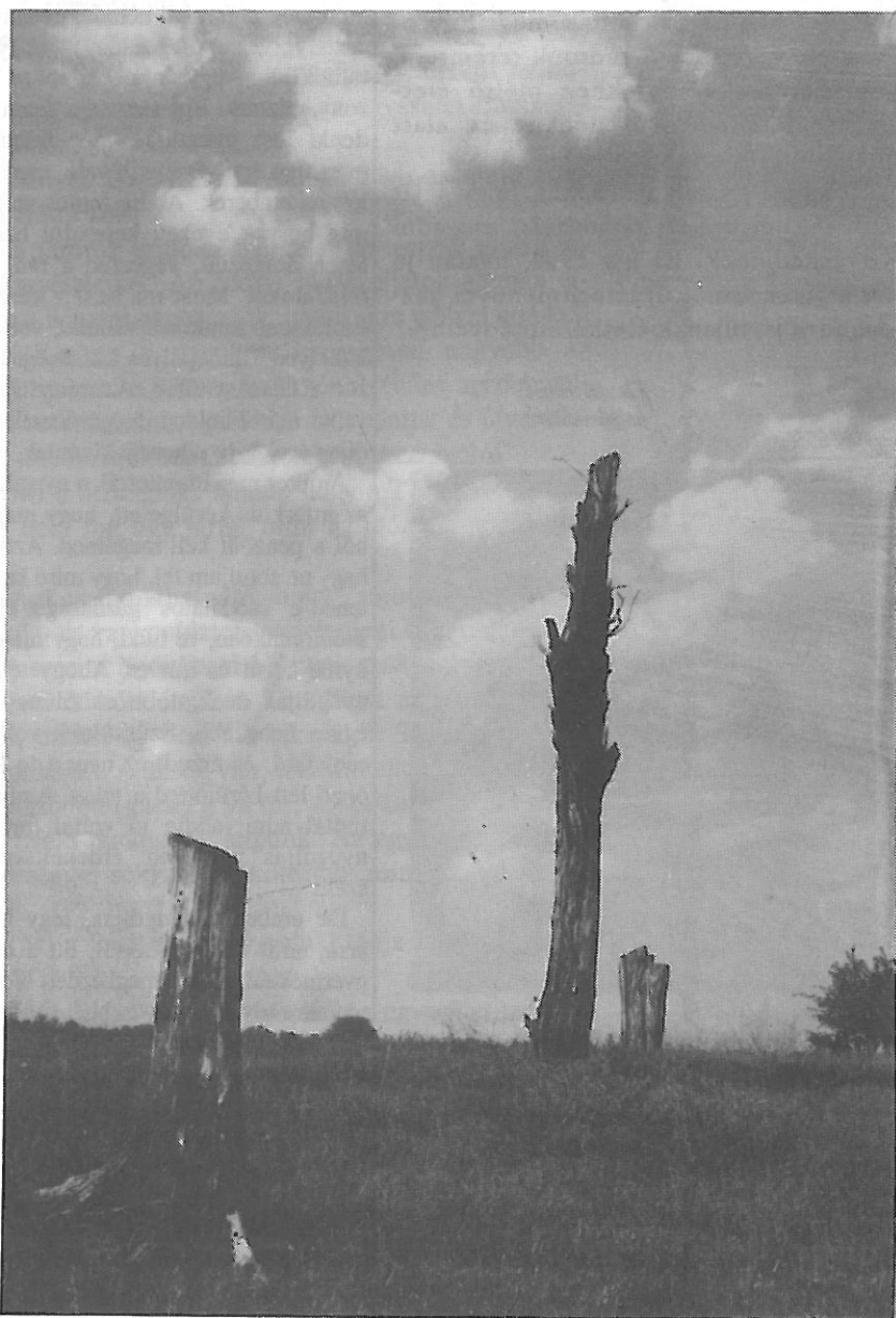
Valahol Táborfalva határában...