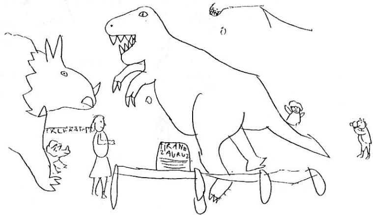
Egy másodikos rajza a Dinoszaurusz-kiállításról

perccel előbb jelezne. (5.) A tanterembe belépve elnézést kérek, és leülök a helyemre. Leülnék, ha nem kémiaóra lenne, ahol az elmés tanár alapszabálya így szól: - "A KÉSŐ FELEL." (6.) A tanár szerencsére elfelejti az általa felállított szabályt. Elfelejtene, ha egyik - jóindulatban túltengő - osztálytársam nem figyelmeztetné erre.