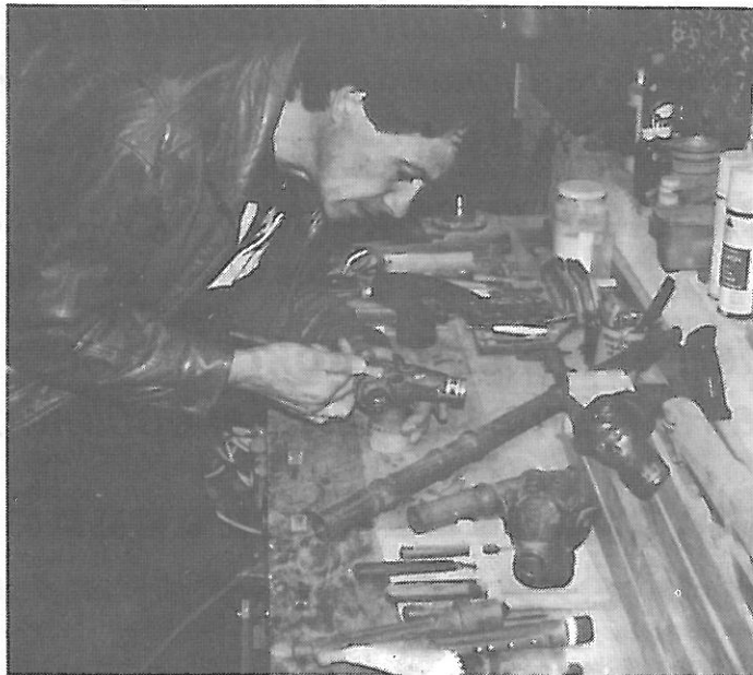
Új hangszer készül

Köszönöm a riportot. További sikeres alkotómunkát kívánok !