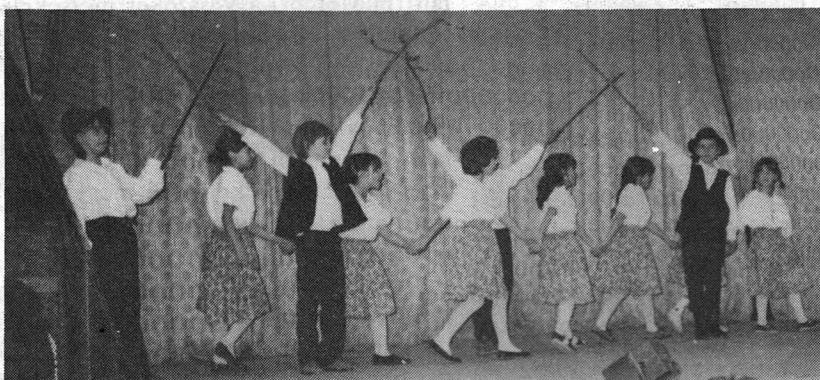
Nagy siker volt a 2. a osztály népi tánca

Bocsánat, hogy élek. Többet nem fordul elő !