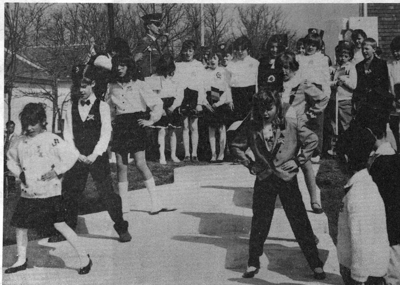
A harmadik osztályosok műsora

(Az idézetek Szelei Pál 1994. március 12-én elhangzott ünnepi beszédéből valók.)