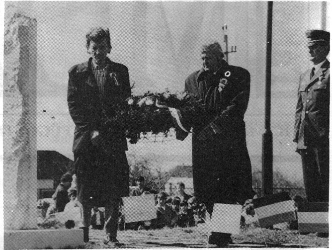
A megemlékezés virágait a helyi SzDSz képviselői is elhelyezték

Tavaly ilyenkor, az emlékmű avatásakor, a meg-