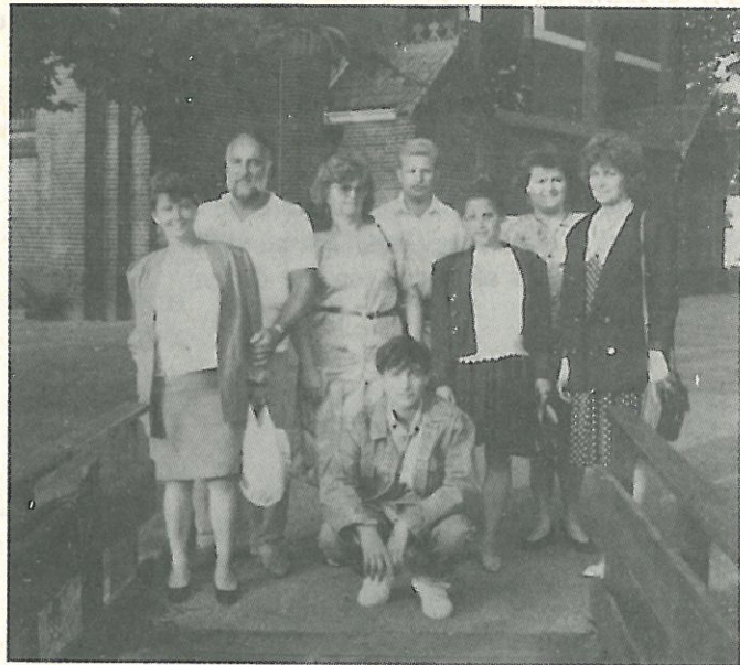
Egy maroknyi táborfalvi Hollandiában

Szűk, kemény, magas vagy túl alacsony sarkú cipő a mozgást gátolja, ezáltal megváltozik a csontok érintkezési pontja (az ízületek máshol érintkeznek, mint ahol az elvárható), így megváltozik a járás, megfájdul a lábfej, a boka, a térd, a hát. Hosszabb idő elteltével sántítani fog az illető. Deformálódik a láb (bütyök, kalapácsujj). Kialakul azon kívül a bőrkeményedés és a tyúkszem! A lábnak e betegségei igen fájdalmasak, nehezen gyógyíthatók, gyakran csak műtéttel csökkenthetők a fájdalmak. Gyógyítani szinte lehetetlen ezeket a betegségeket! Marad tehát a megelőzés. Jól megválasztott, kényelmes, bőrből készült cipő. Gyere-