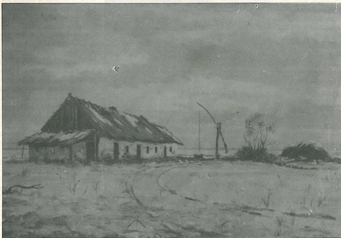
Sárosy A. I.: Téli hangulat

tartalomból: Múltidéző Élettörténet kaptafánál Holland emlék Kertészkedőknek Kutyaolag? Hát nem minden fenéig tejföl Vadásznapi miniSuliság A láb Egy festményt nem lehet ... Leiki élet Házi praktikák